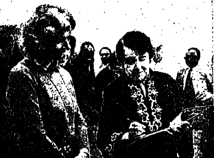
توليح للذكرى، ال اليصار دولا فورد حارلمان